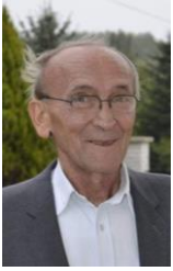
Pável Árpád Váróterem