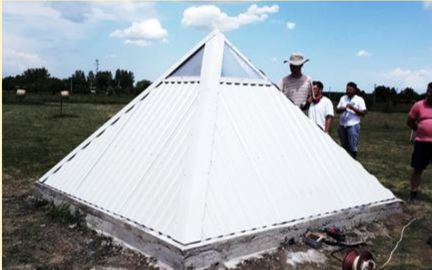
kép: Tószeg Avilai Szt Teréz magántemplom